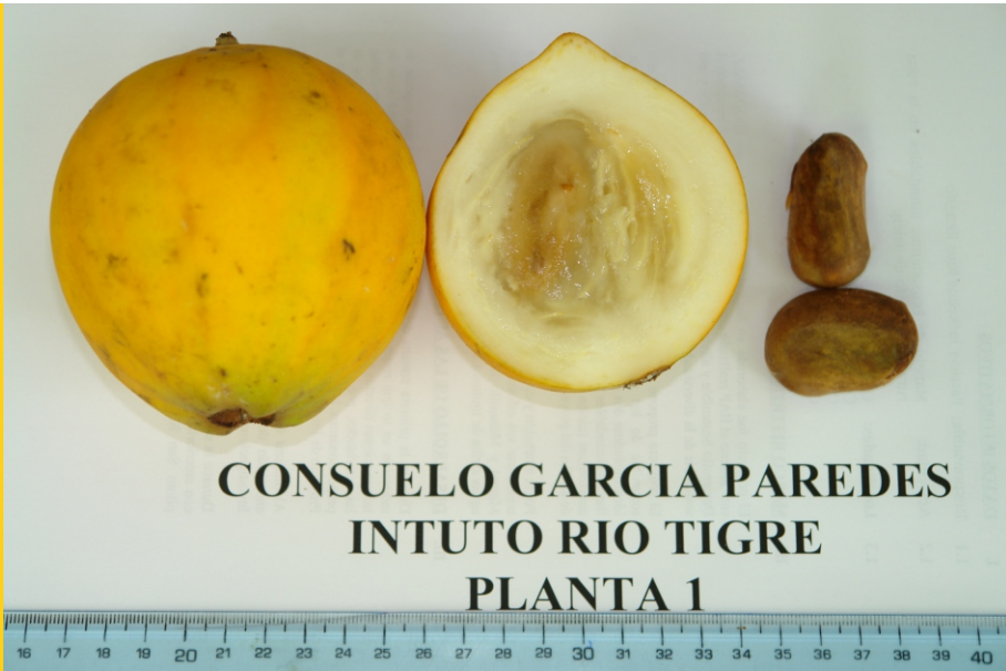
CONSUELO GARCIA PAREDES INTUTO RIO TIGRE PLANTA 1

La planta madre debe ser buena productora de frutos en términos de cantidad y calidad. Los frutos provenientes de plantas matrices deben ser evaluados en muestras de 30 frutos y se deben seleccionar aquellas muestras de frutos que presenten menor variabilidad en el peso, tamaño, número de semillas, contenido de azúcares o grados brix y rendimiento de pulpa.