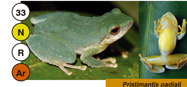
33 Pristimantis padiali