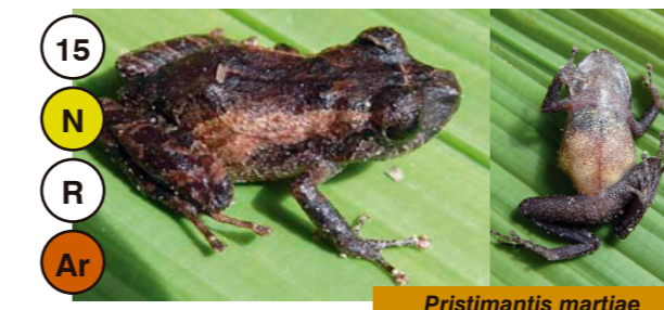
15 Pristimantis martiae