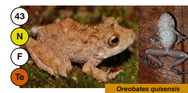
43 Oreobates quixensis

Te Ar Ac Hábito: Terrestre, Arborícola o Acuático