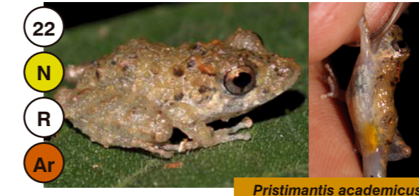
22 Pristimantis academiscus