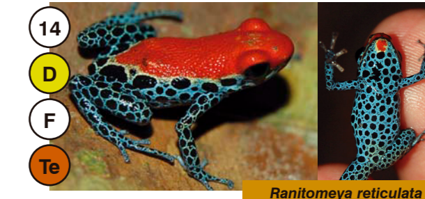
14 Ranitomeya reticulata