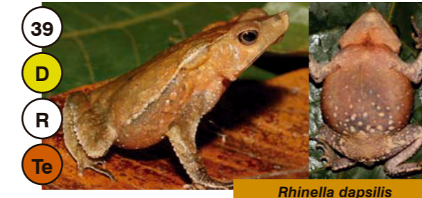
39 Rhinella dapsilis