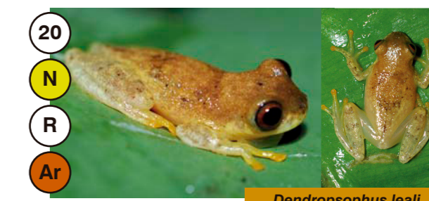
20 Dendropsophus leali