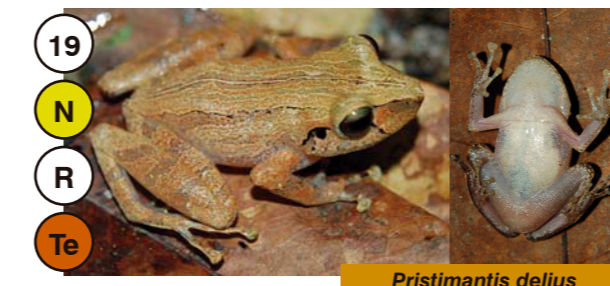
19 Pristimantis delius