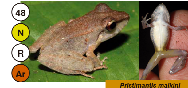
48 Pristimantis malkini