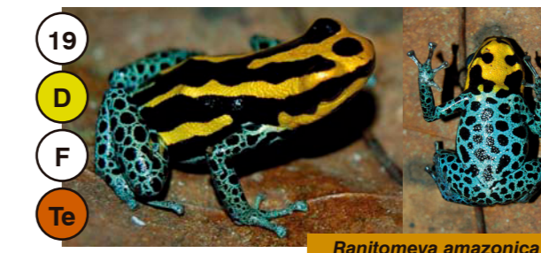
19 Ranitomeya amazonica