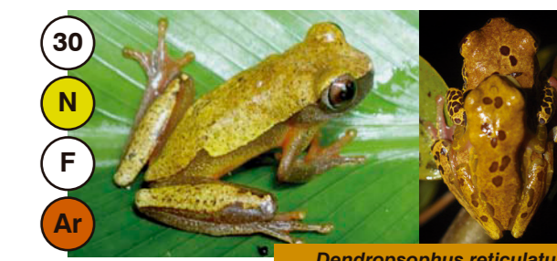
30 Dendropsophus reticulatus