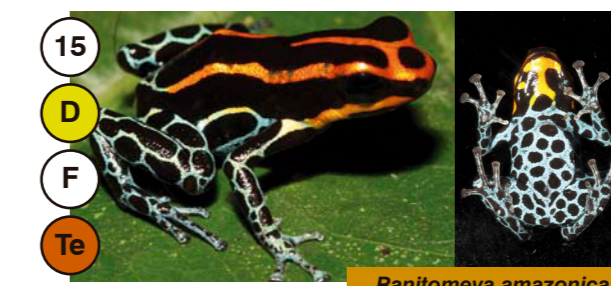
15 Ranitomeya amazonica