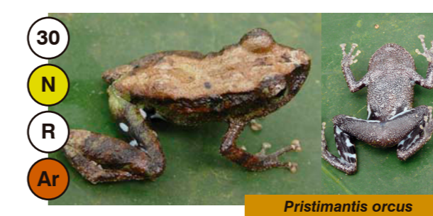
30 Pristimantis orcus