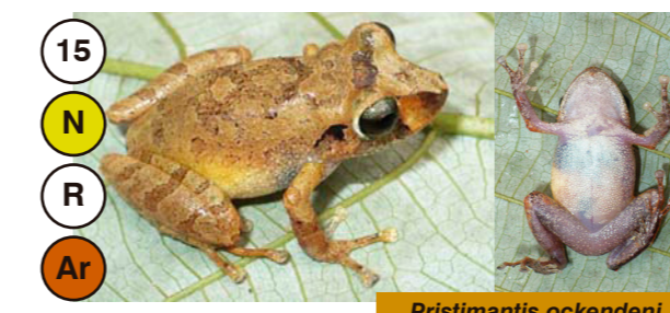
15 Pristimantis ockendeni