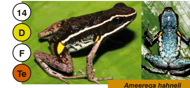
14 Ameerega hahnelli