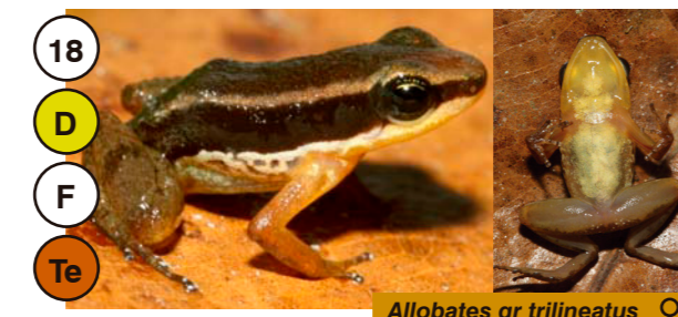
18 Allobates gr trilineatus ♀