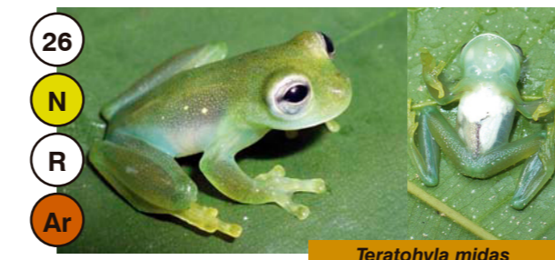
26 Teratohyla midas