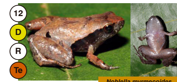
12 Noblella myrmecoides

Te Ar Ac Hábito: Terrestre, Arborícola o Acuático