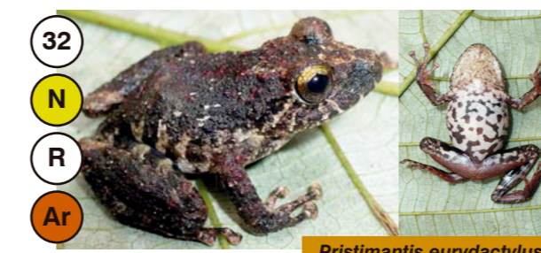
32 Pristimantis eurydactylus