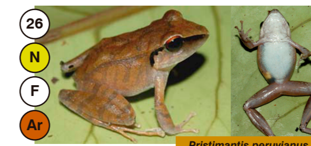
26 Pristimantis peruvianus