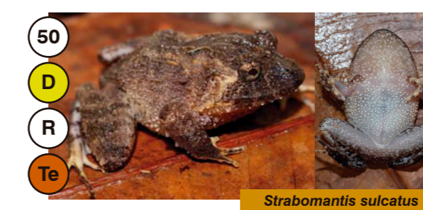
50 Strabomantis sulcatus