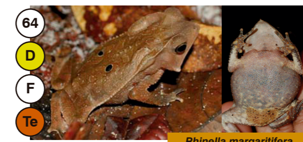
64 Rhinella margaritifera

R F A Abundancia: Raro, Frecuente o Abundante