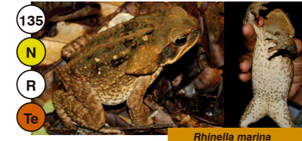
135 Rhinella marina