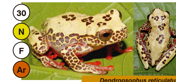
30 Dendropsophus reticulatus