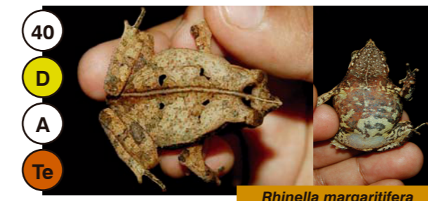
40 Rhinella margaritifera