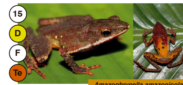
15 Amazophrynella amazonicola

15 Tamaño: Longitud Hocico-cloaca (mm) D N Actividad: Día o Noche