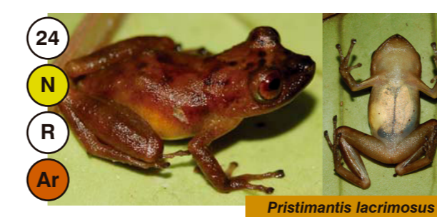
24 Pristimantis lacrimosus