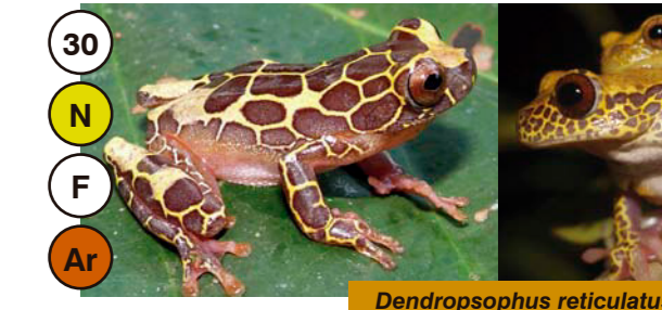
30 Dendropsophus reticulatus