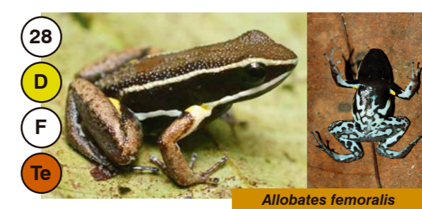
28 Allobates femoralis

INSTITUTO DE INVESTIGACIONES DE LA AMAZONIA PERUANA (IIAP)