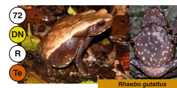
72 Rhaebo guttatus

15 Tamaño: Longitud Hocico-cloaca (mm) D N Actividad: Día o Noche