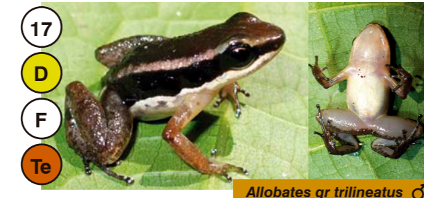
17 Allobates gr trilineatus ♂