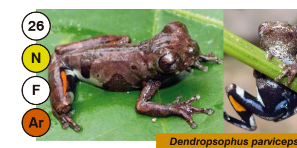
26 Dendropsophus parviceps