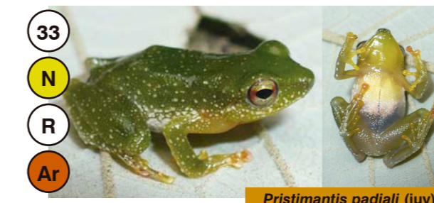
33 Pristimantis padiali (juv)