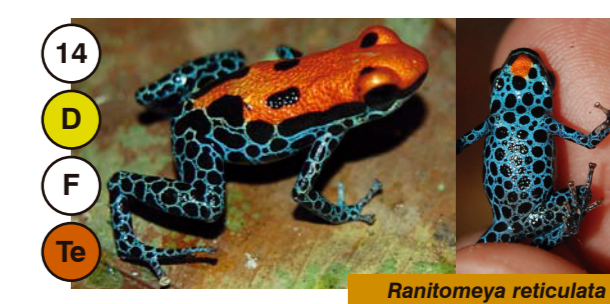
14 Ranitomeya reticulata