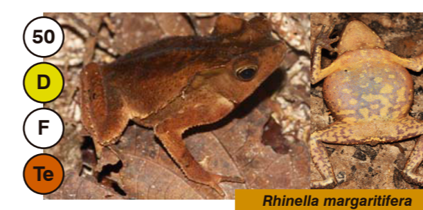
50 Rhinella margaritifera

R F A Abundancia: Raro, Frecuente o Abundante