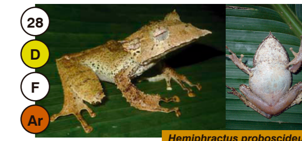
28 Hemiphraactus proboscideus