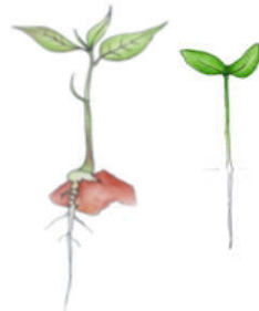
Fig. 1: Germinación Hipogea en Caoba (Izquierda) y Germinación Epigea en Cedro (Derecha)