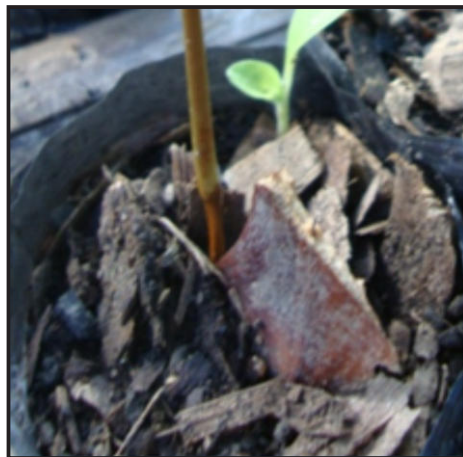
Foto 12: Planta con síntomas de estrangulamiento a nivel del suelo

f) Control de plagas: Aplicaciones preventivas de benomyl para enfermedades y clorpiriphos ataque de insectos, son ideales para el control de plagas. Otras alternativas es la aplicación de ceniza (espolvoreado), sobre el sustrato. También la aplicación de Microorganismos de Montaña para prevención o minimizar el daño. Cuando se realiza esta actividad de preferencia rotar los productos por otros para no generar resistencia de las plagas.