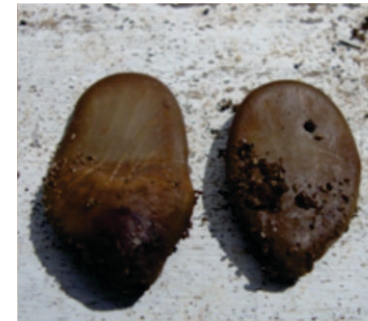
Foto 9: Semilla de Pino chuncho ( Schizolobium amazonicum ), con corte de salida radical (I) y Semilla sin corte de salida radical (d)

c) Control de malezas: Se debe realizar el deshierbo del perímetro y de las plantas que crecen en las bolsas almacigueras para controlar el micro clima y prevenir el ataque de plagas.