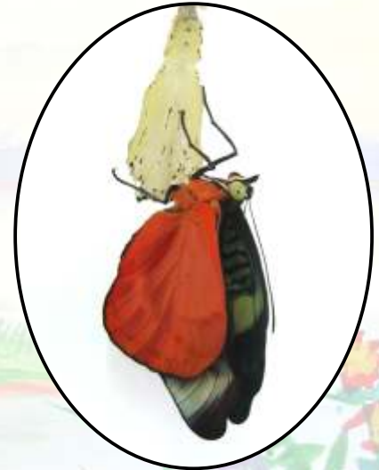
ENDURECIMIENTO DE ALAS